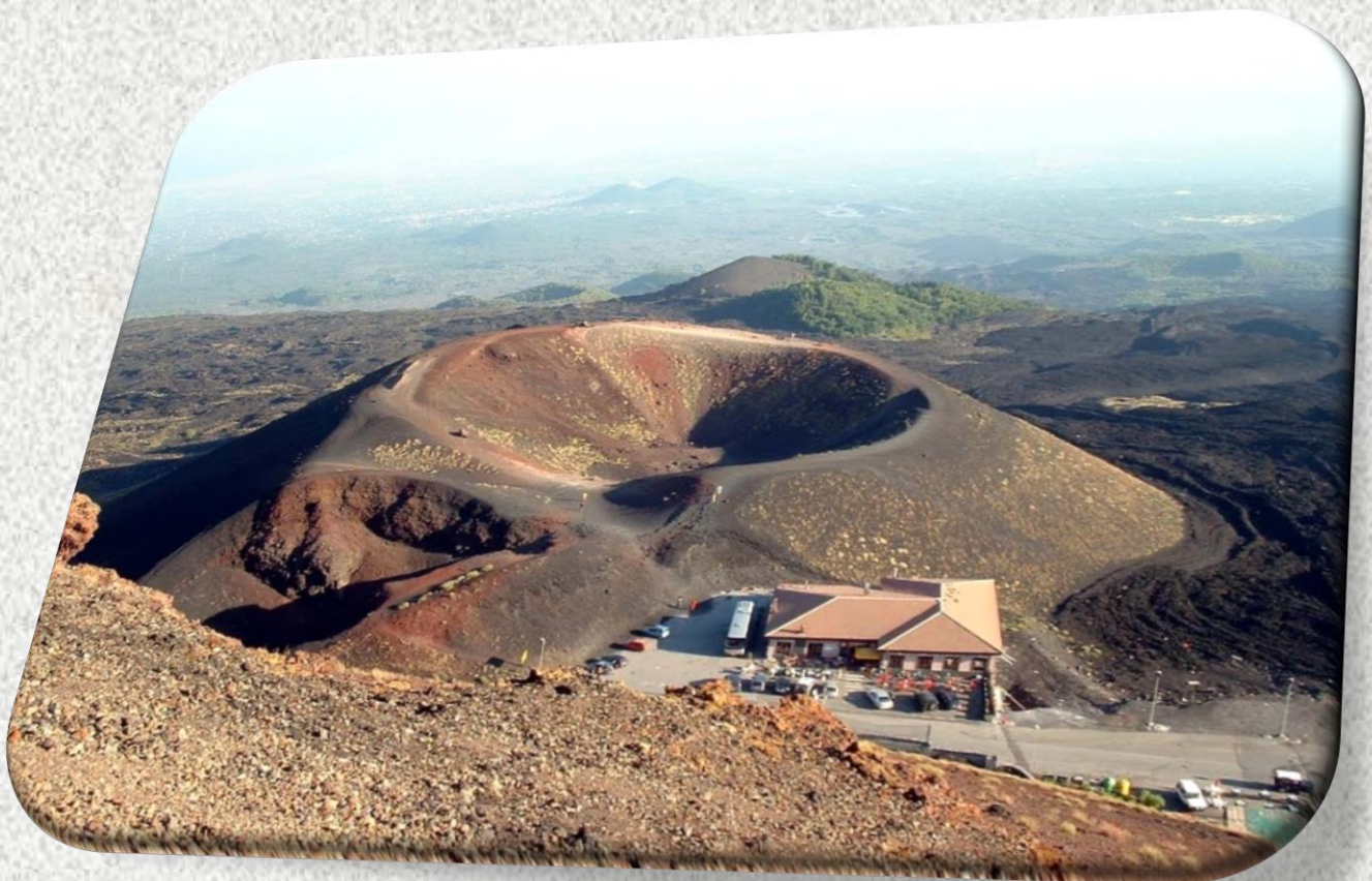
Fig. 6 Rifugio Sapienza