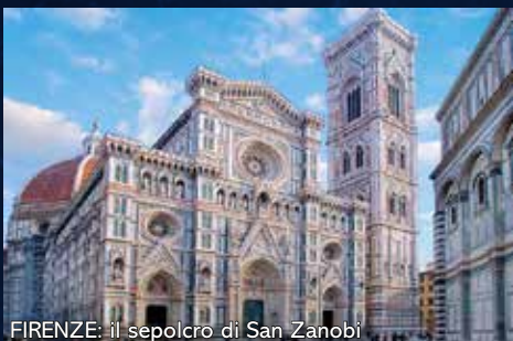
FIRENZE: il sepolcro di San Zanobi

UN CAMMINO immerso NELLA NATURA. UN CAMMINO che unisce LUOGHI DI FEDE, DI TRADIZIONE, DI ARTE E CULTURA.