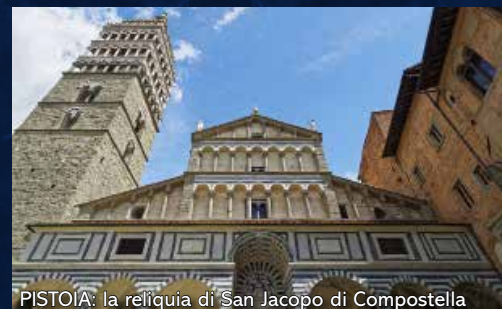
PISTOIA: la reliquia di San Jacopo di Compostella