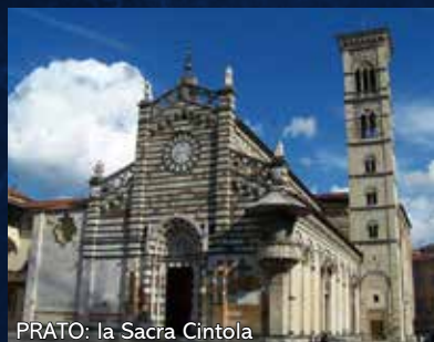
PRATO: la Sacra Cintola