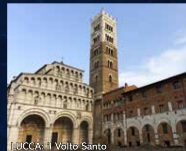
LUCCA: il Volto Santo