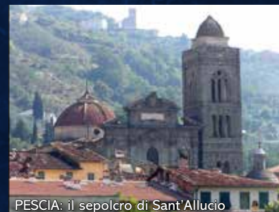
PESCIA: il sepolcro di Sant'Allucio