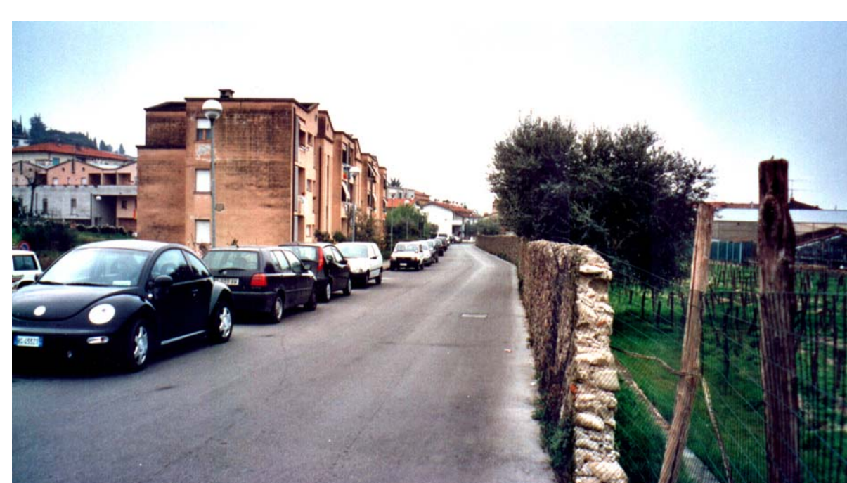
Via degli Orti