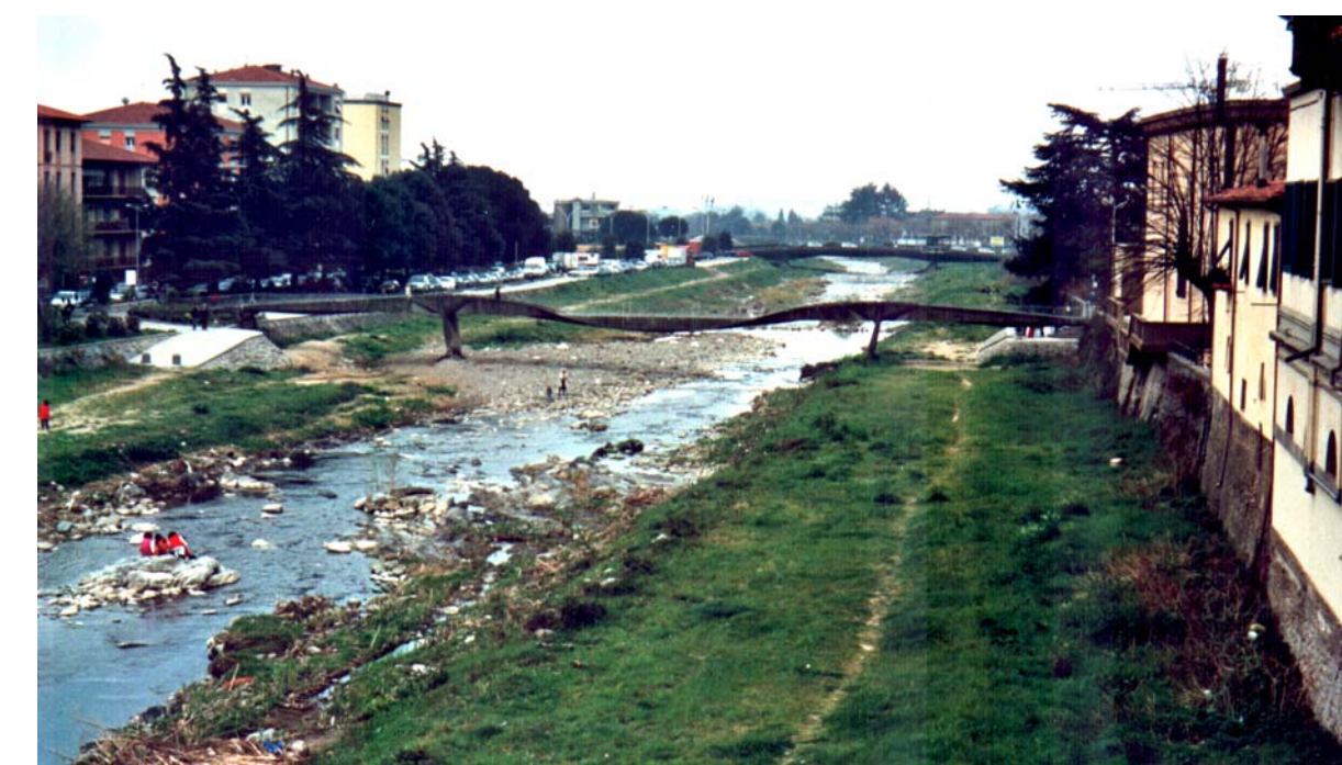
La vista del fiume Pescia verso sud