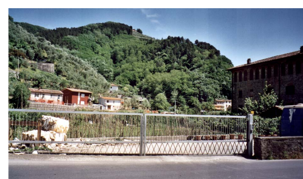
La collina vicino S. Lorenzo