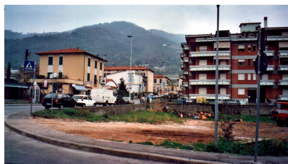
L'edificato accanto a Ponte Europa