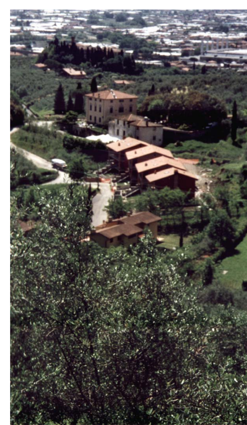
L'edificato dietro la villa Putt