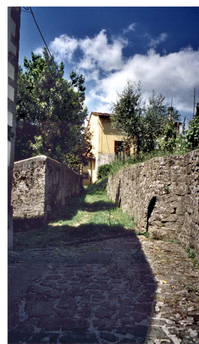
Monte a Pescia