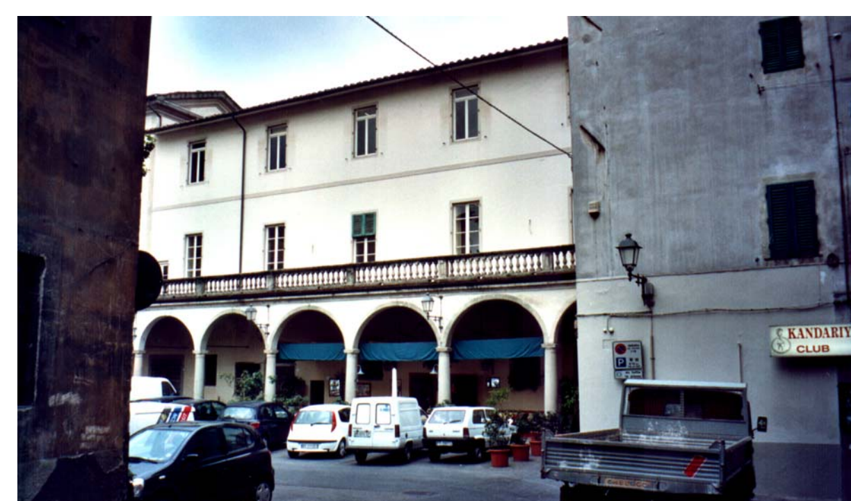
La piazza del Grano