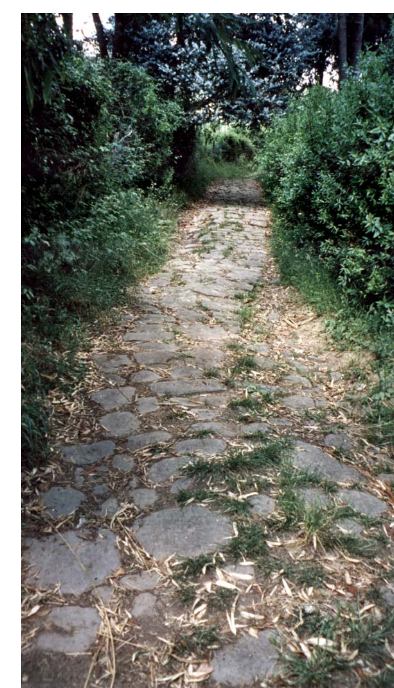
Via della Fiaba