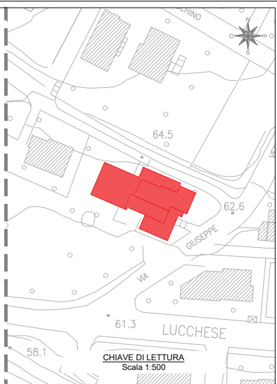
CHIAVE DI LETTURA Scala 1:500

- LEGENDA - REALIZZAZIONE DI NUOVO CANCELLO AUTOMATICO CON FARETTI PER ILLUMINAZIONE REALIZZAZIONE DI PAVIMENTAZIONE ANTITRALMA