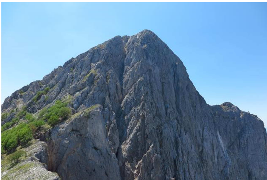
La Parete Nord del Pizzo D'Uccello dal Picco Capradossa

L'attività propedeutica alla via ferrata, che peraltro è di moderate difficoltà tecniche, è finalizzata ad un buon utilizzo della montagna; è importante non avere particolari problemi con il vuoto, avere gli scarponi da trekking con suola rigida e ben scolpita e nello zaino qualche ricambio, oltre la giacca a vento, almeno un litro e mezzo di acqua e da mangiare per il pranzo a piacere; ma anche cioccolato, frutta fresca o secca o comunque piccoli spuntini; a piacere ma consigliati, i guanti, il cappellino, occhiali da sole, crema protettiva, macchina fotografica.